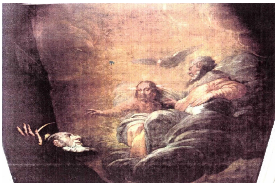
4. Pedro Calabria Escudero: San Benito y La Trinidad . Después de la Restauración. Bóveda de la Iglesia de Montserrat. Madrid.