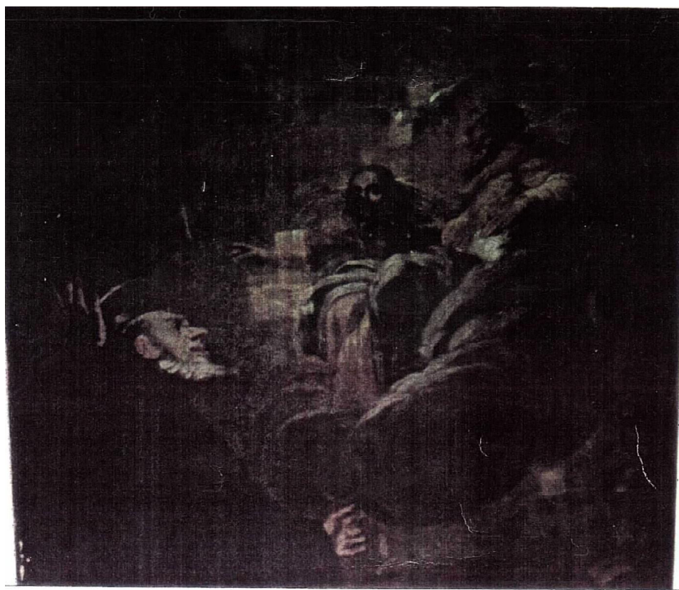
3. Pedro Calabria Escudero: San Benito y La Trinidad . Antes de la Restauración. Bóveda de la Iglesia de Montserrat. Madrid.