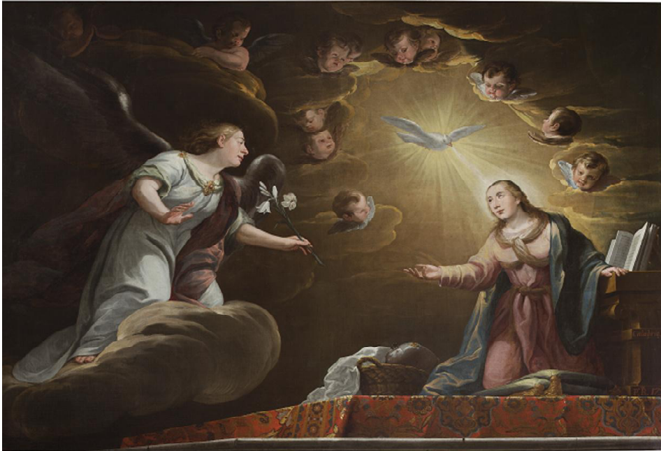
1. Pedro Calabria Escudero: Anunciación de la Virgen . Universidad Central. Barcelona.