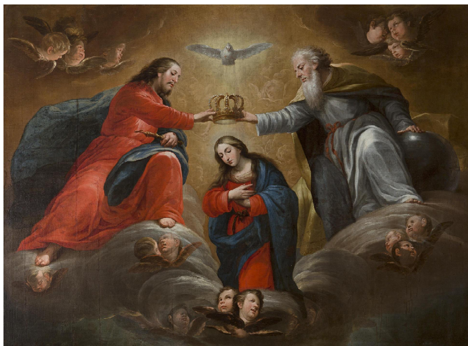
2. Pedro Calabria Escudero: Coronación de la Virgen . Universidad Central. Barcelona. Depósito del Museo del Prado.

pendida por encima de la cabeza de la Virgen. Los angelitos se agrupan de tres en tres y alguna vez de dos y uno se representa aislado. Jesucristo porta una cruz latina premonición de la Pasión. Dios Padre, con barbas apoya su mano en la bola del mundo símbolo de su poder.