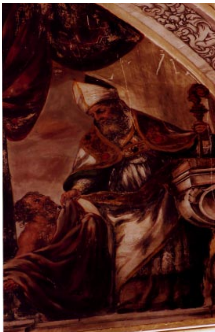
5. San Martín . Juan de Valdés Leal. Iglesia de la Santa Caridad. Sevilla.

toda una extensa nómina de calamidades privadas que contrasta con la pública opulencia de otras familias.