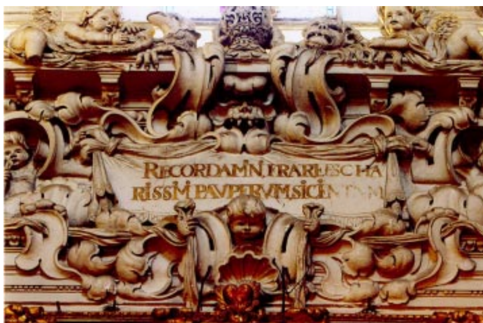
4. «Recordad, queridos hermanos, de los pobres es nuestro reino» Iglesia de la Santa Caridad. Sevilla..