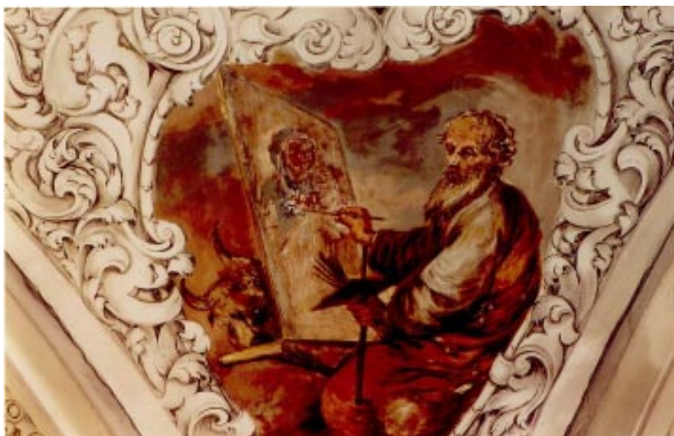
7. San Lucas . Juan de Valdés Leal. Iglesia de la Santa Caridad. Sevilla.