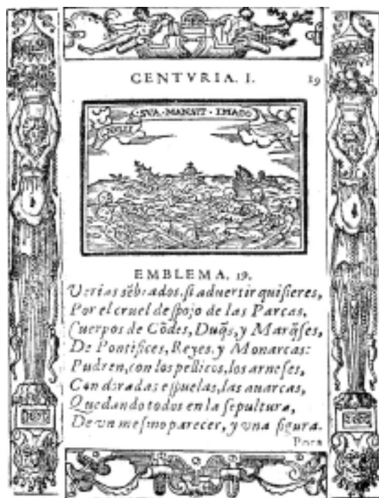
2. Emblemas Morales. Sebastián de Covarrubias.

En efecto, en un primer plano del cuadro, dotado de una dramática iluminación, vemos el cadáver de un obispo devorado por los gusanos. (“Tienes bajo tí una cama de gusanos, tus mantas son gusaneras” Isaias, 14, 2.) Sus restos, apenas entrevistos entre la vestimenta pontifical, aparecen momificados o en plena descomposición. Más atrás, en otro desvencijado ataud, un caballero de Calatrava duerme su último sueño bajo el cobijo de su aristocrático manto. Algunos autores afirman que, tal vez, fuera esta imagen el retrato de don Miguel. Para mí, no existe la menor duda, pues es el propio padre Cárdenas quien así lo confirma: “A si mismo se pintó difunto, consumida la carne, descubriendo sólo el almazón de la calavera y huesos” 26 . Por si este testimonio fuera poco, uno de los testigos del Proceso Ordinario, el Conde de Torrepalma, declaraba: “que en uno de ellos -se refiere naturalmente a los lienzos- mandó pintar en un ataud un caballero muerto con el manto capitular de el Orden de Calatrava, comenzando el rostro a comer de gusanos; y que dijo el testigo el Siervo de Dios algunas veces que el haberlo hecho pintar asi era por ser aquel su retrato verdadero” 27 .