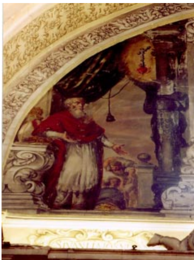
3. San Julian . Juan de Valdés Leal. Iglesia de la Santa Caridad. Sevilla.