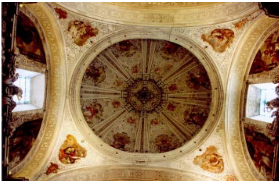
6. Cúpula . Juan de Valdés Leal. Iglesia de la Santa Caridad. Sevilla.